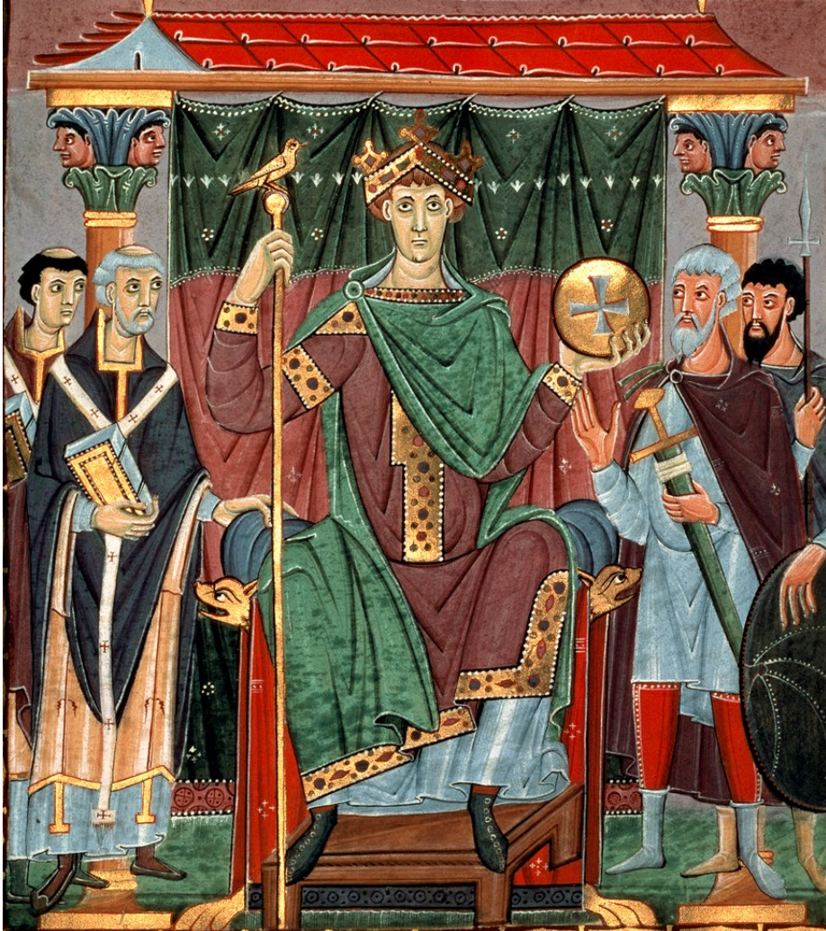
▲ C'est grâce à Otton III, empereur des Romains, au centre sur cette enluminure du X e siècle, que Gerbert d'Aurillac (à gauche) devient le pape Sylvestre II en 999.

L'instrument de Gerbert n'est pas une simple variante de l'abaque classique, grec ou romain, mais bien une adaptation du calcul arabe se déroulant avec la numération positionnelle. Grâce à des colonnes, l'abaque de Gerbert rend possible un calcul sans recourir au zéro, qui est remplacé par un espace vide. Le zéro – qui