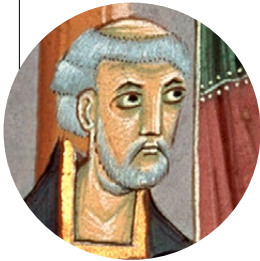
▲ Gerbert d'Aurillac.

Au X e siècle, Gerbert d'Aurillac, moine d'origine modeste, devient un savant majeur de son époque. Fêré de mathématiques, il invente un outil de calcul qui introduira les chiffres arabes en Occident. Ce qui n'entravera pas son accession au trône pontifical.