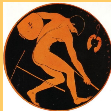
Lancer du disque sur une coupe antique, vers 500 avant J.C

suivantes : saut en longueur, course d'un stade (192m), lancer de disque, lancer de javelot et lutte.